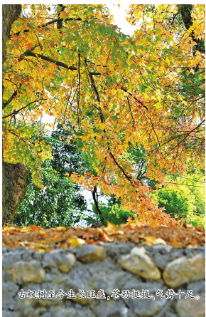
古枫树至今生长旺盛,苍劲挺拔,气势十足。