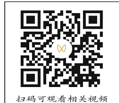
扫码可观看相关视频