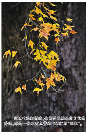
当枫叶逐渐变红,全身的颜色显出了它的轮廓,那是一份不需要点缀的“饱满”与“张狂”。

“生态兴则文明兴,生态衰则文明衰。古树名木是生态环境文明的‘眼睛’,见证了生态文明的兴衰,有自然生态和人文历史的双重价值,是生态环境的重要组成部分。开展好古树名木保护,是贯彻习近平生态文明思想的生动实践,是实现‘望得见山,看得见水,记得住乡愁’愿景的必经之路。未来,元格村将做好宣传,让每个人都成为古树名木保护的倡导者、推动者、建设者,大家群策群力,共同为‘善待古树名木,留住美丽乡愁’作出新的更大贡献。”元格村相关负责人说。