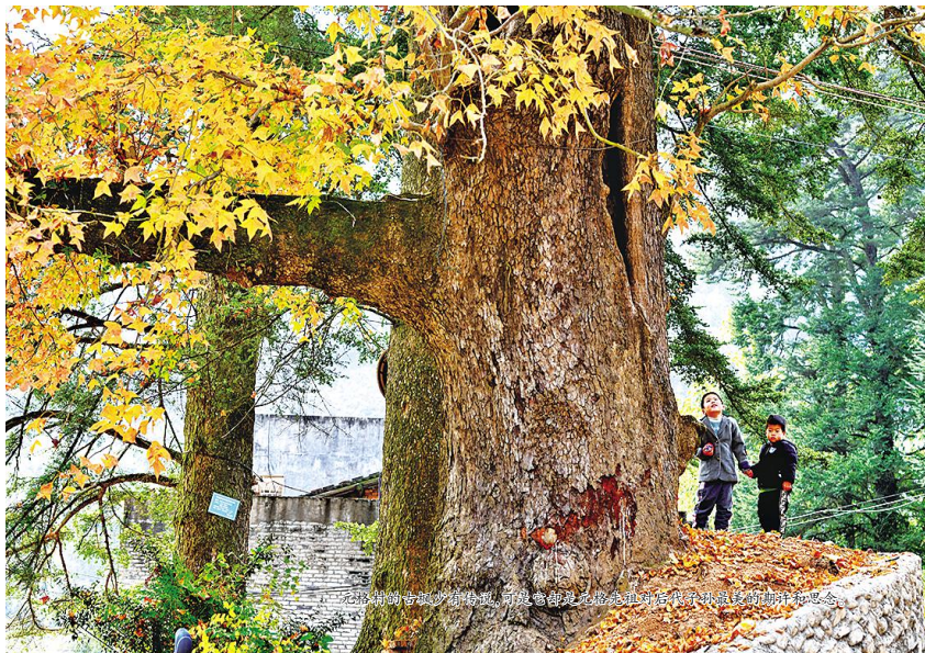
元格村的古枫少有传说,引发当地居民和后代子孙最美的期许和思念