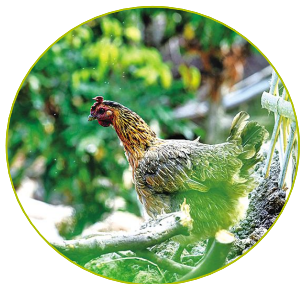
▲ 古树下,鸡犬相闻的乡村景象,牵起了多少乡愁。