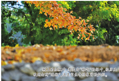
树上的红枫叶,都是由“绿”的绿叶,经秋风吹拂而“蜕变”,这是它生命成熟前的过程。