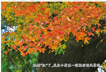
枫树“红”了,成为小村又一道亮丽的风景线