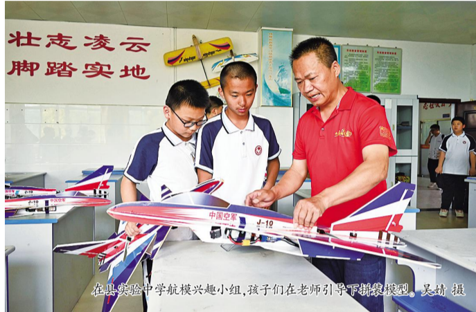
在县实验中学航空兴趣小组，孩子们在老师引导下拼装模型。吴婧 摄