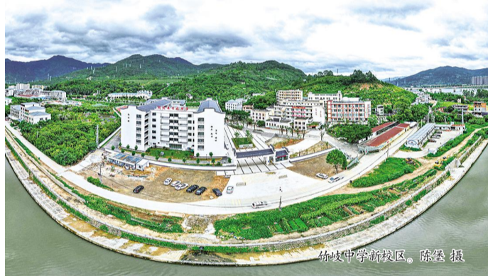
竹岐中学新校区。