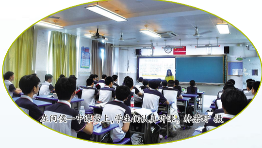
在闽侯一中课堂上，学生们认真听讲。

少年智则国智，少年强则国强！此次高考，闽侯县第一中学的学子们用可喜的成绩，证明了“闽侯少年之智”。欲穷千里目，更上一层楼！相信在未来，在县委、县政府的关心支持下，闽侯一中将在不断善谋善变中，在社会各界的肯定中，持续强化师资建设，以此作为“笔”挥毫泼墨，续写这所百年名校的灿烂与辉煌！