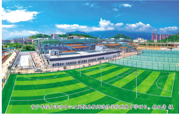
青少年校外活动中心及闽侯县教师进修学校附属中学项目。