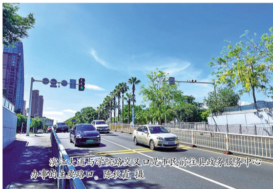
滨江大道与学院路交叉口是市民前往县政务服务中心办事的主要路口。