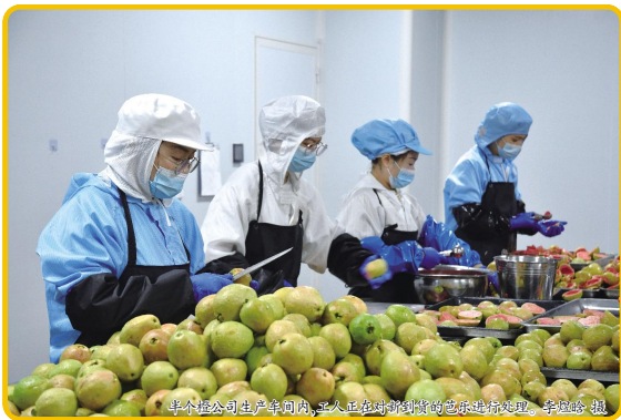
半棵公司在生产车间内，工作人员在对新到的芭乐进行预处理。