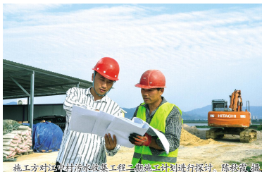
施工方工作人员正在收集二期施工进度计划进行探讨。

■ 融媒体中心记者组 项目建设是夯实民生基础的“牛鼻子”。今年以来，我县始终坚持以人民为中心的发展思想，聚焦群众急难愁盼问题，全力推进一批打基础、利长远的民生项目建设，切实把民生工程打造成群众满意的民心工程。