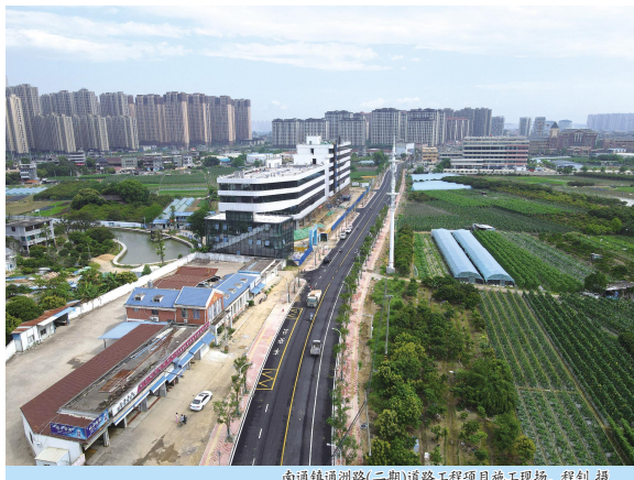
南通镇通洲路(二期)道路工程项目建设现场。

接自各户改造或新增的标准三格化粪池，实现污水的集中收集。收集后的污水将通过污水提升泵站处理，再排入现状污水管网，确保污水得到妥善处理、达标排放。